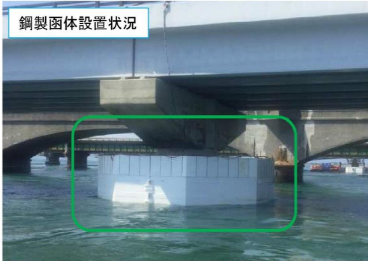
鋼製函体設置状況