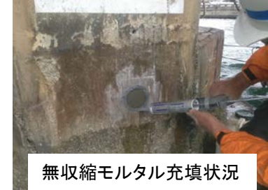
無収縮モルタル充填状況