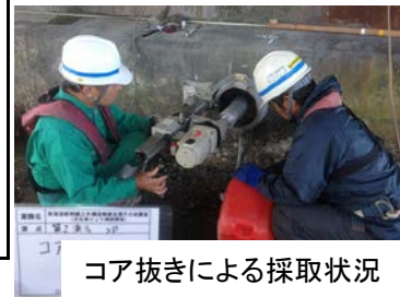
コア抜きによる採取状況